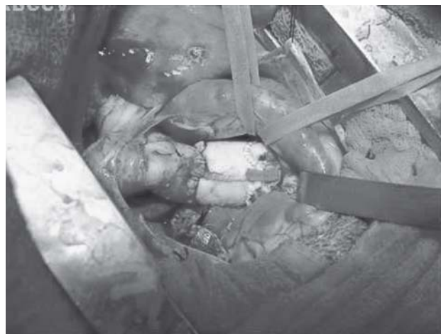
Fig. 2 - Aspecto final da cirurgia

Para desfibrilação, foi utilizado um choque elétrico de 15 Joules. A ventilação mecânica foi reiniciada e preparada a saída de CEC. Atingidas as condições hemodinâmicas e respiratórias consideradas satisfatórias, a CEC foi descontinuada. A Figura 2 mostra o aspecto final da cirurgia. Realizada a hemostasia. Retirada das cânulas do átrio direito, do átrio esquerdo e da aorta. Por veia periférica, foi iniciada infusão contínua de protamina na dosagem 1 ml para cada 1000UI de heparina. Por fim, o pericárdio foi fechado na sua parte inferior e passado um dreno tubular de 30 Fr ao nível do sexto espaço intercostal esquerdo e realizada a síntese da parede torácica por planos anatômicos.