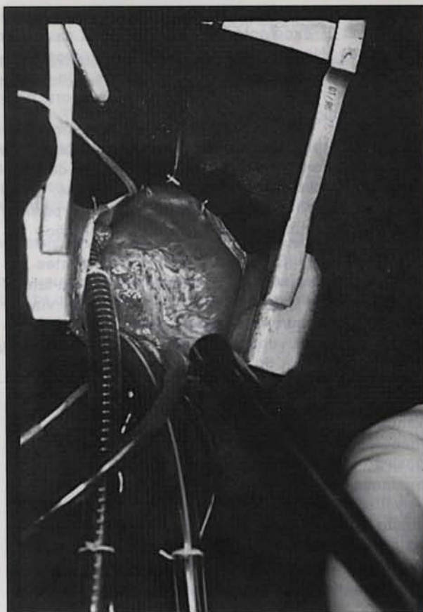
Fig. 2 - Campo cirúrgico da abordagem transxifóidea com o afastador de esterno desenvolvido pela Bioengenharia do Incor e as cânulas de extracorpórea posicionadas - cava superior (cânula aramada) e inferior. O toracoscópio, situado inferiormente e à direita, é utilizado para visibilização das câmaras cardíacas esquerdas e aorta.

O interesse pelo desenvolvimento de técnicas cirúrgicas menos invasivas, através de incisões cada vez menores e com o auxílio de equipamentos de videoendoscopia vem aumentando progressivamente. O maior conforto para o paciente, o menor tempo de internação hospitalar e o menor número de complicações pós-operatórias justificam a tendência atual. Na cirurgia cardíaca, algumas operações, denominadas minimamente invasivas, têm sido realizadas para revascularização do miocárdio sem circulação extracorpórea (1) e em trocas valvares aórticas e mitrais (2) com auxílio da videoendoscopia, geralmente utilizadas para biópsia e drenagem pericárdica, fechamento de canal arterial e secção e sutura de anel vascular pulmonar (3, 4) .