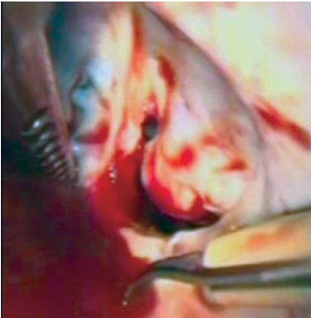
Fig. 3 - Aspecto pré-operatório da valva mitral, demonstrando estenose crítica