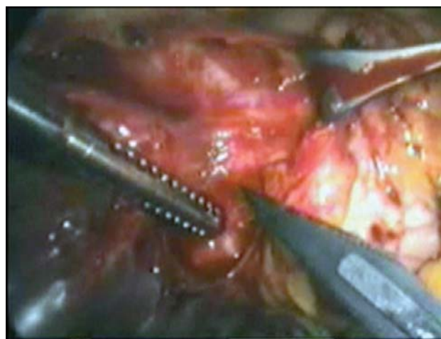
Fig. 1 - Local da atriotomia, com exposição da veia pulmonar superior direita, abaixo do nervo frênico

seu tempo total foi de 140 minutos. A paciente foi extubada ainda na sala cirúrgica; permaneceu na UTI por 30 horas, com boa evolução, recebendo alta da unidade. No quarto dia de pós-operatório, apresentou hemoptise súbita e retornou à UTI, sendo diagnosticada hemorragia pulmonar em lobo inferior direito, sem causa cirúrgica detectável. A possibilidade, apesar de tardia, de reexpansão forçada do pulmão direito, após entubação seletiva durante a cirurgia, poderia ser uma causa. Não foi utilizado cateter de Swan Ganz, que poderia ser outra causa de hemorragia pulmonar. Permaneceu na unidade por mais 7 dias, recebendo alta hospitalar com 15 dias de evolução pós-operatória. O controle ecocardiográfico demonstrou correção da estenose mitral, com área estimada em 2,2 cm 2 , sem gradiente transvalvar e insuficiência leve, queda da PAPS a valores normais (55 para 20 mmHg) e assintomática após um seguimento de 24 meses, inclusive com gestação em andamento.