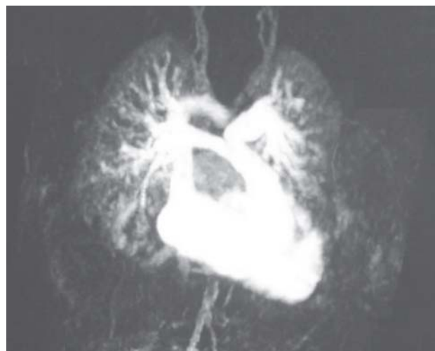
Fig. 2 - Angiorressonância nuclear magnética avaliando as artérias pulmonares e a via de saída do ventrículo direito