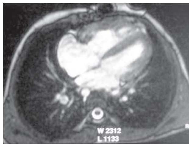
Fig. 1 - Angiorressonância nuclear magnética mostrando as quatro câmaras

d) Avaliação hemodinâmica não-invasiva do ventrículo direito nos 10 pacientes submetidos a angiorressonância. Para tanto, foram avaliados: fração de ejeção do ventrículo direito (FEVD), volume diastólico final do ventrículo direito (VDFVD), volume sistólico do ventrículo direito (VSVD), massa do ventrículo direito (MVD) e fração de regurgitação pulmonar (FRP). Ademais, analisou-se a morfologia das artérias pulmonares.