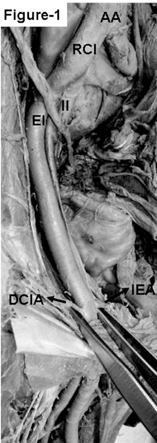
Fig. 1 – Fotografia da região pélvica. A aorta abdominal (AA) é vista dividindo no nível superior, assim como também a artéria ilíaca comum direita (ICD). Os ramos terminais da artéria ilíaca externa (IE), isto é, a artéria epigástrica inferior (AEI) e artéria ilíaca profunda circunflexa (AICP) podem ser vistos. II é a artéria ilíaca interna.

Durante disseção de rotina, uma forma de artéria anormal foi observada em um cadáver do sexo masculino com 65 anos. A aorta abdominal estava consideravelmente deslocada lateralmente e também bifurcada nas artérias ilíacas comuns num nível mais alto, perto da vértebra L3. A artéria ilíaca comum direita seguiu um padrão similar e terminou nas artérias ilíacas, interna e externa no nível da vértebra L4. A artéria ilíaca externa direita deu origem as